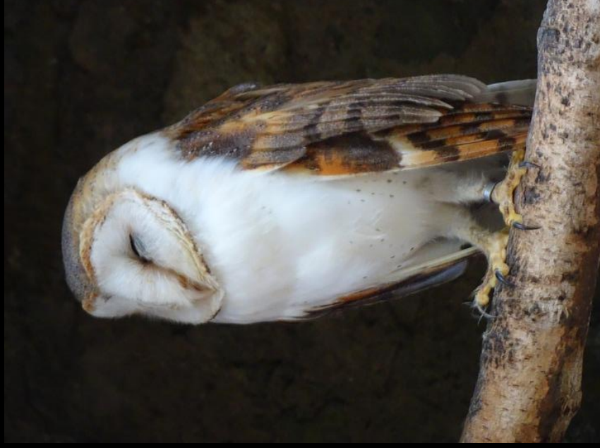
Effraie des clochers